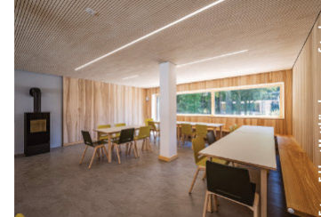
Haus „Alte Mühle“